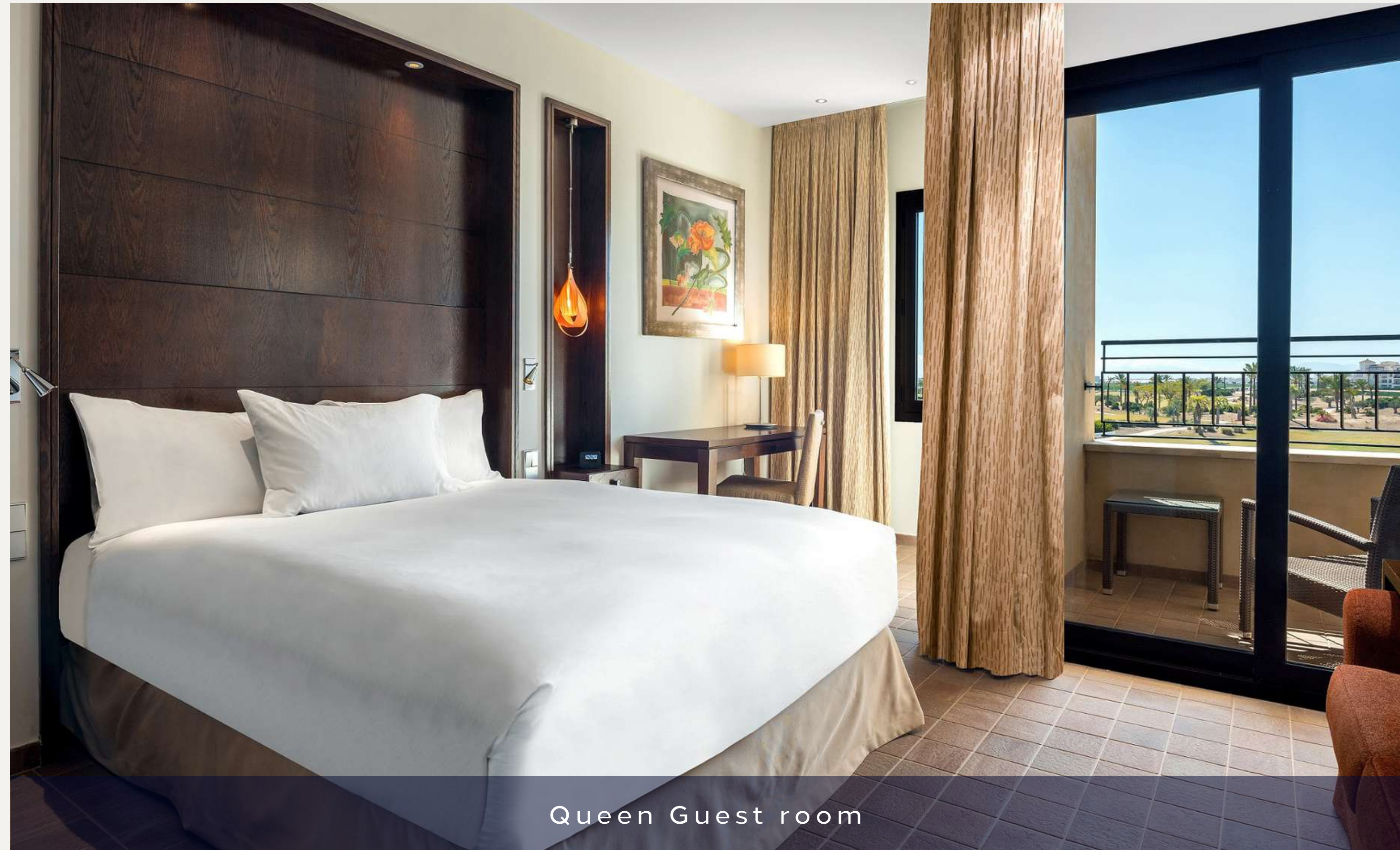
Queen Guest room