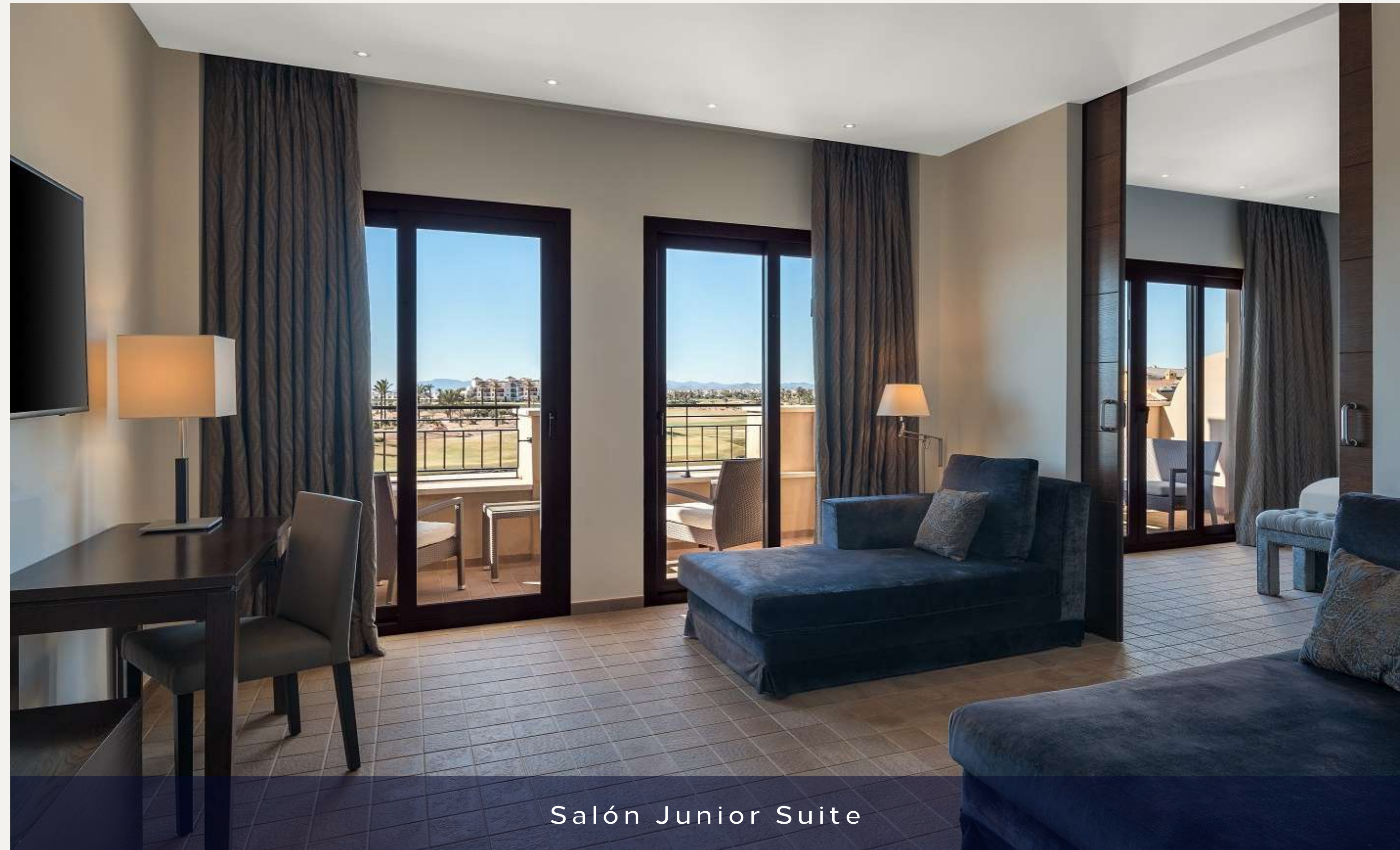
Salón Junior Suite