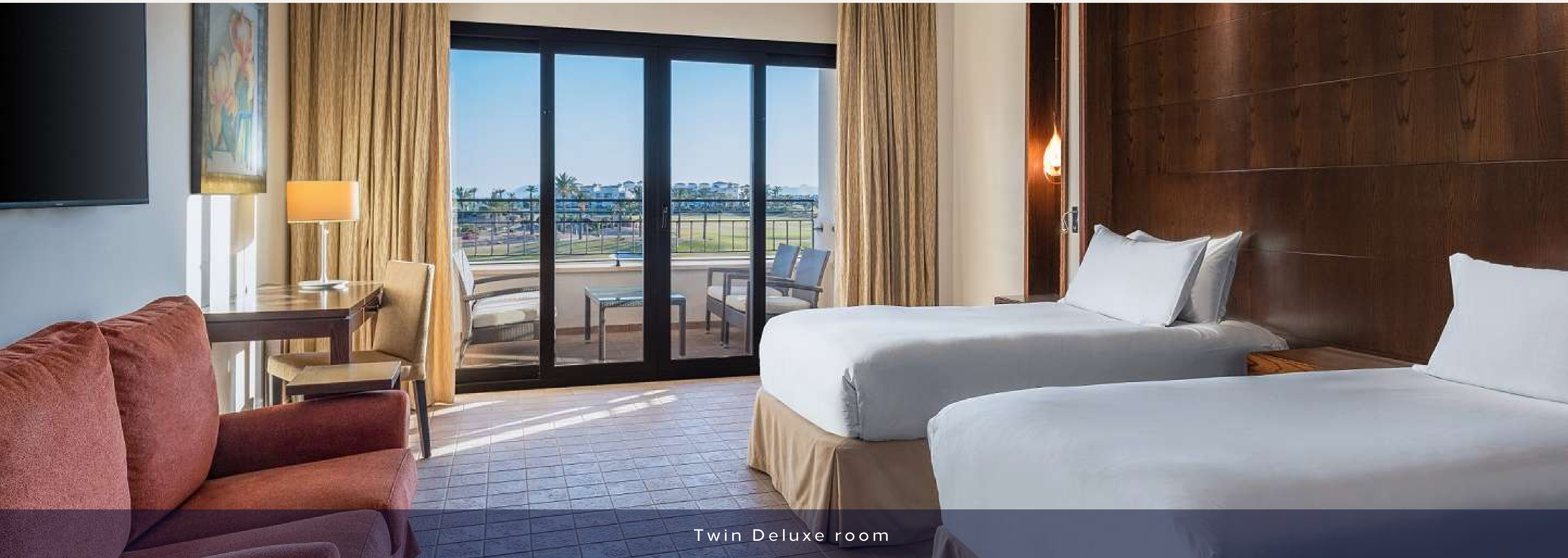
Twin Deluxe room

133 habitaciones: 46 Twin y 87 King Size bed. Categoría: Deluxe room.