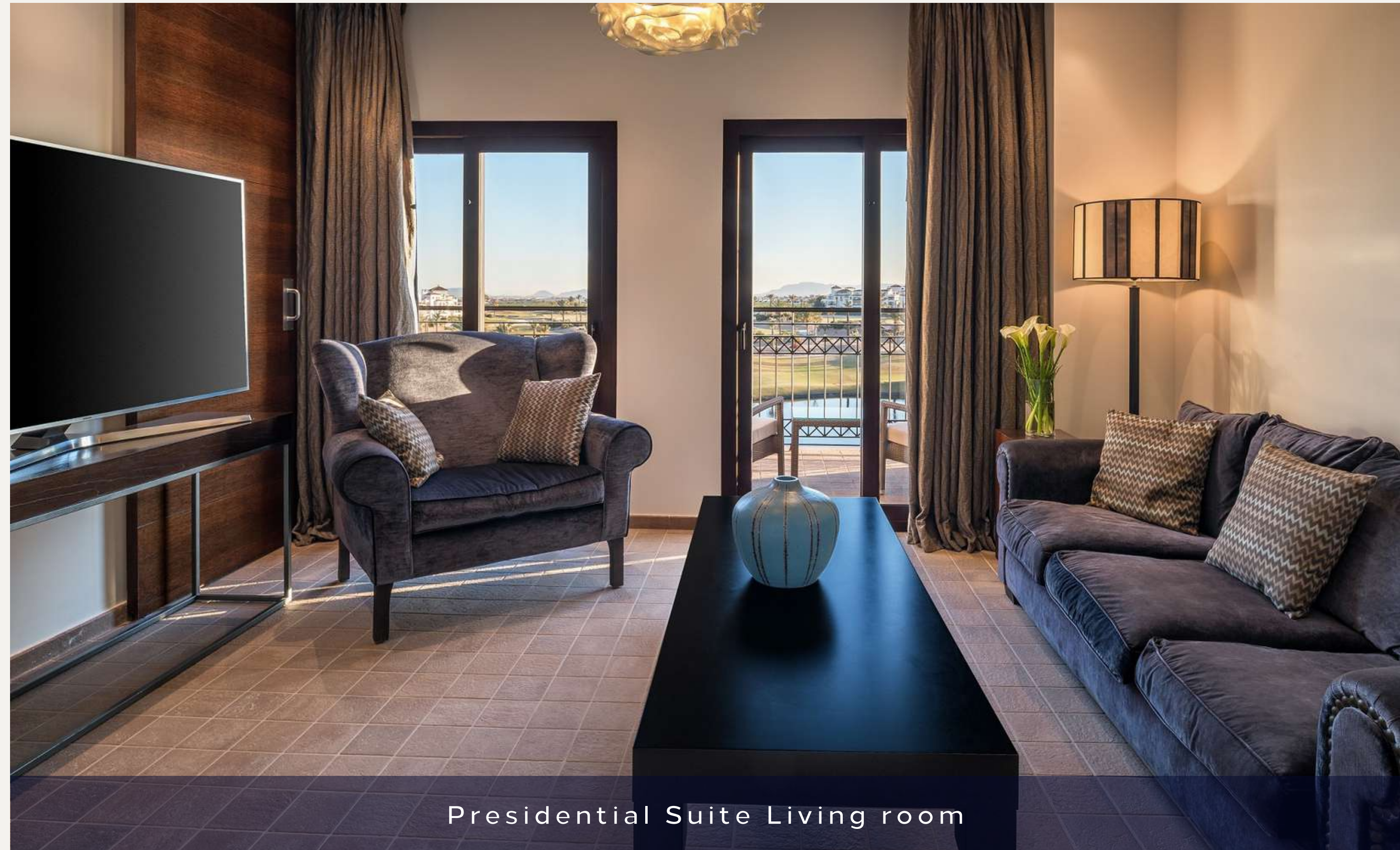
Presidential Suite Living room