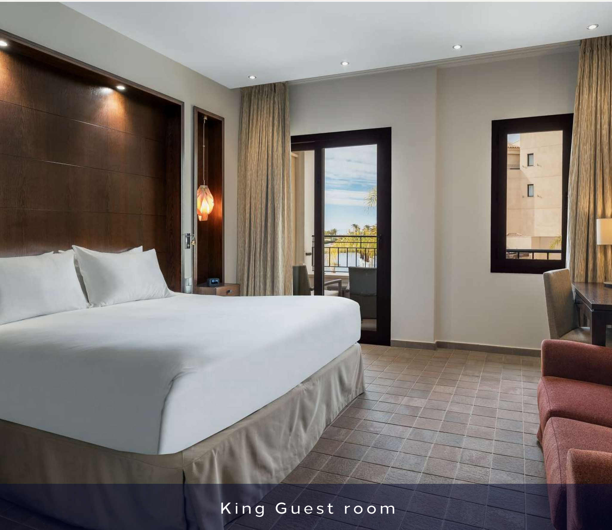
King Guest room

133 habitaciones: 46 Twin y 87 King Size bed. Categoría: Guest room.