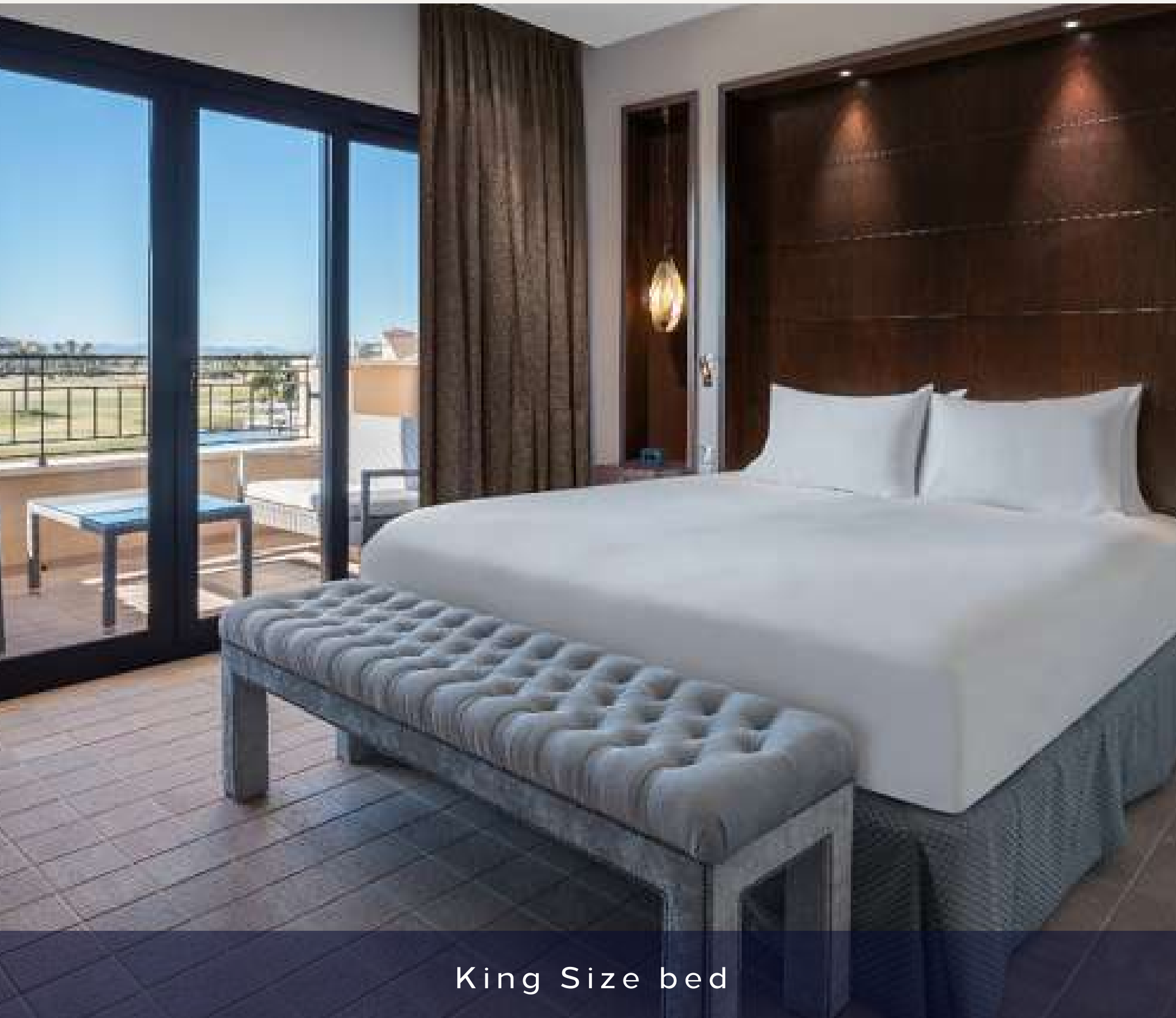
King Size bed

133 habitaciones: 46 Twin y 87 King Size bed. Categoría: King Size.