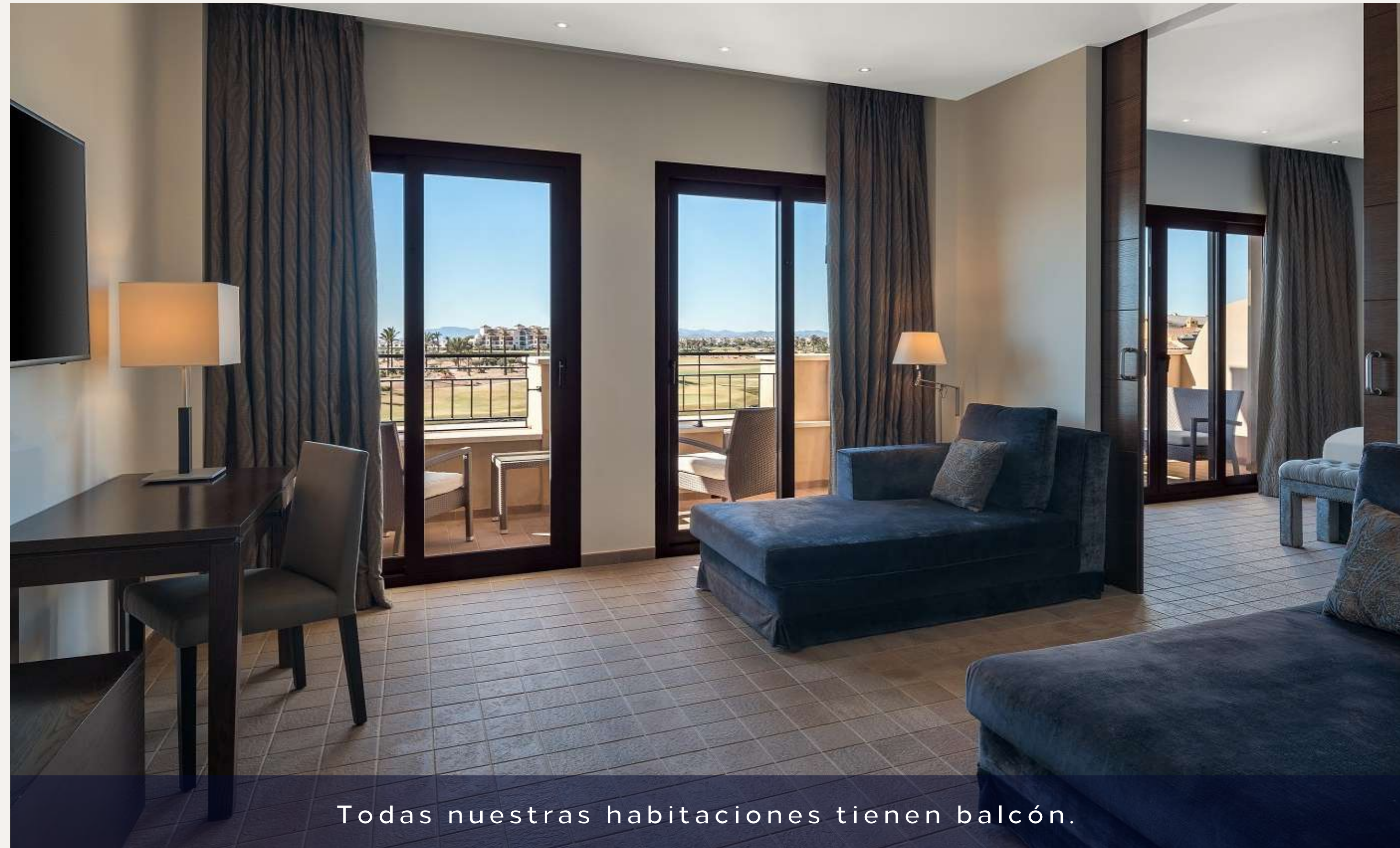
Todas nuestras habitaciones tienen balcón.