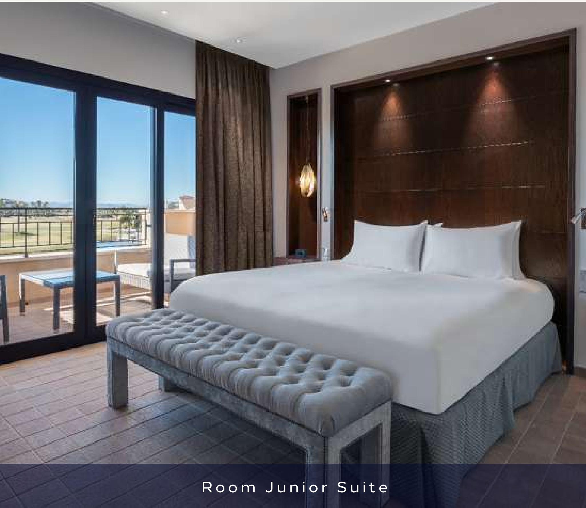
Room Junior Suite

133 habitaciones: 46 Twin y 87 King Size bed. Categoría: Junior One Bedroom Suite.