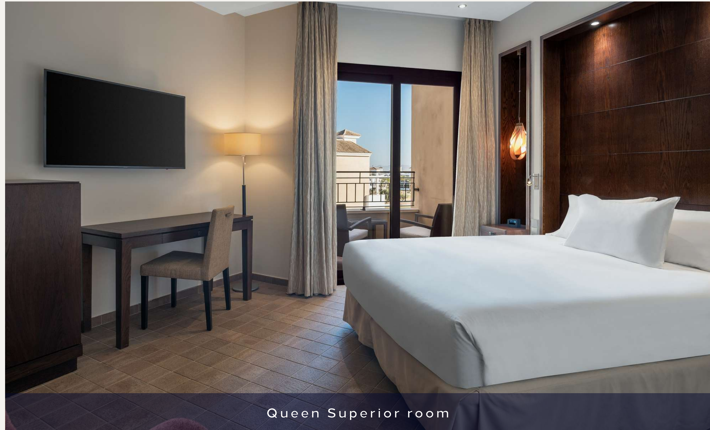
Queen Superior room