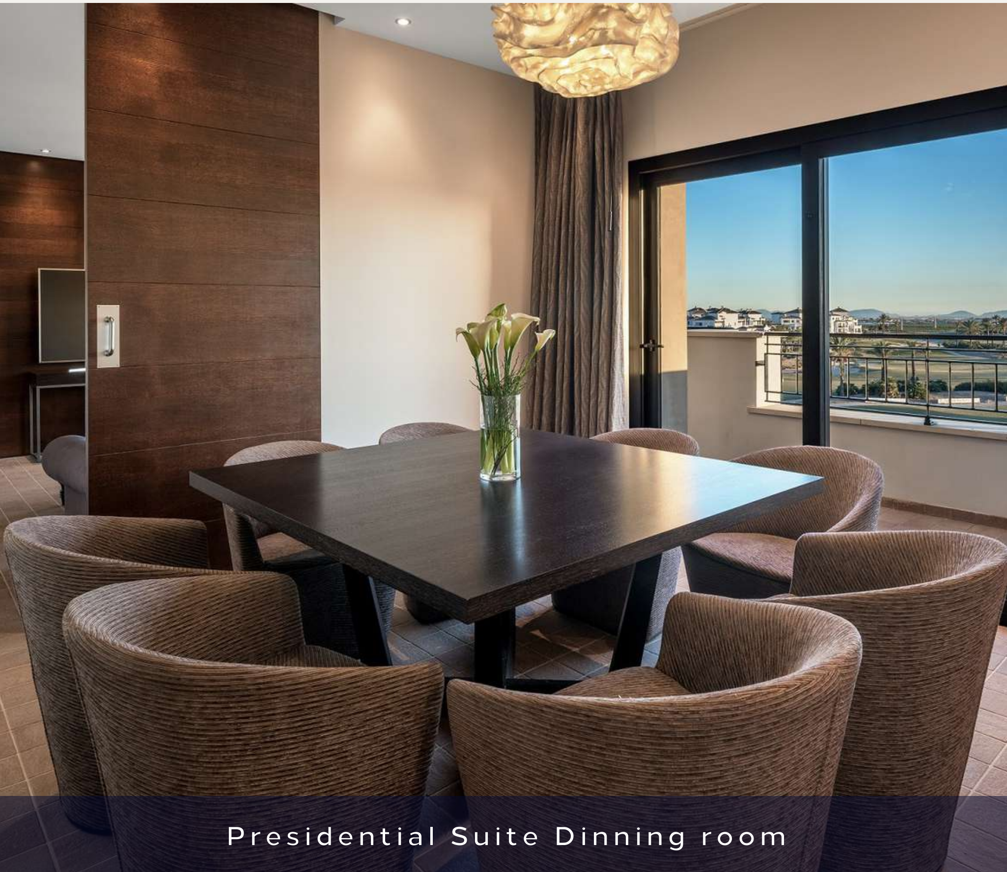
Presidential Suite Dinning room

133 habitaciones: 46 Twin y 87 King Size bed. Categoría: Presidential Suite.