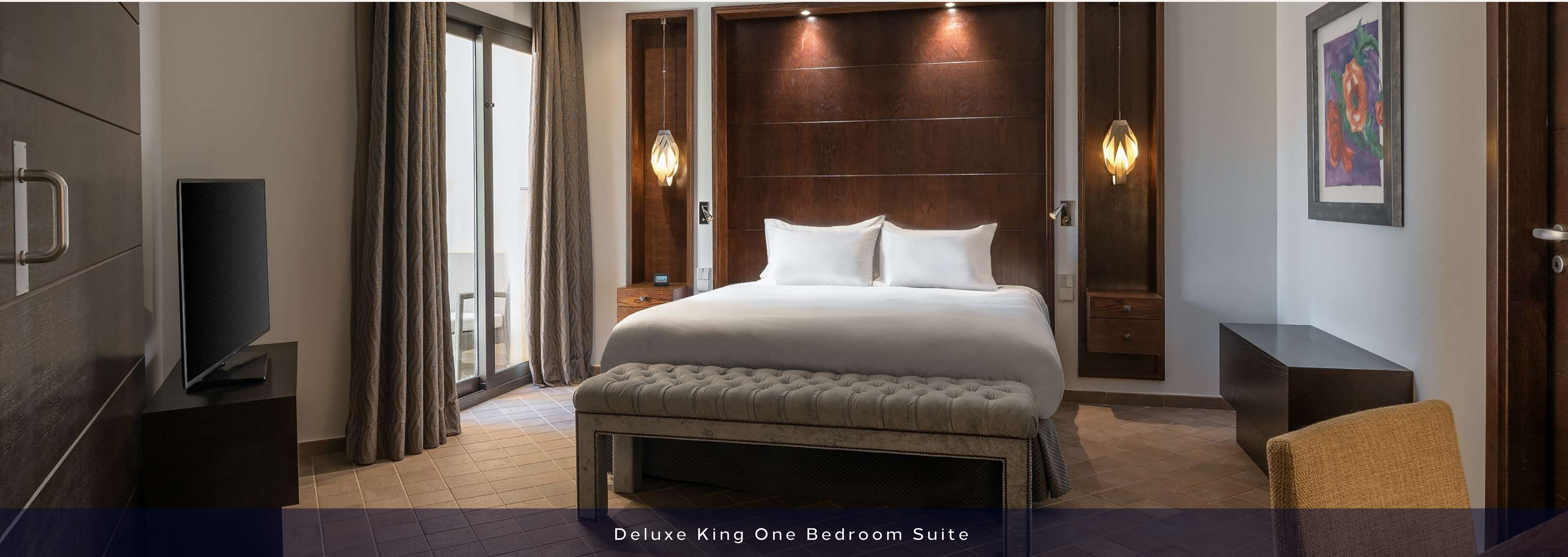
Deluxe King One Bedroom Suite