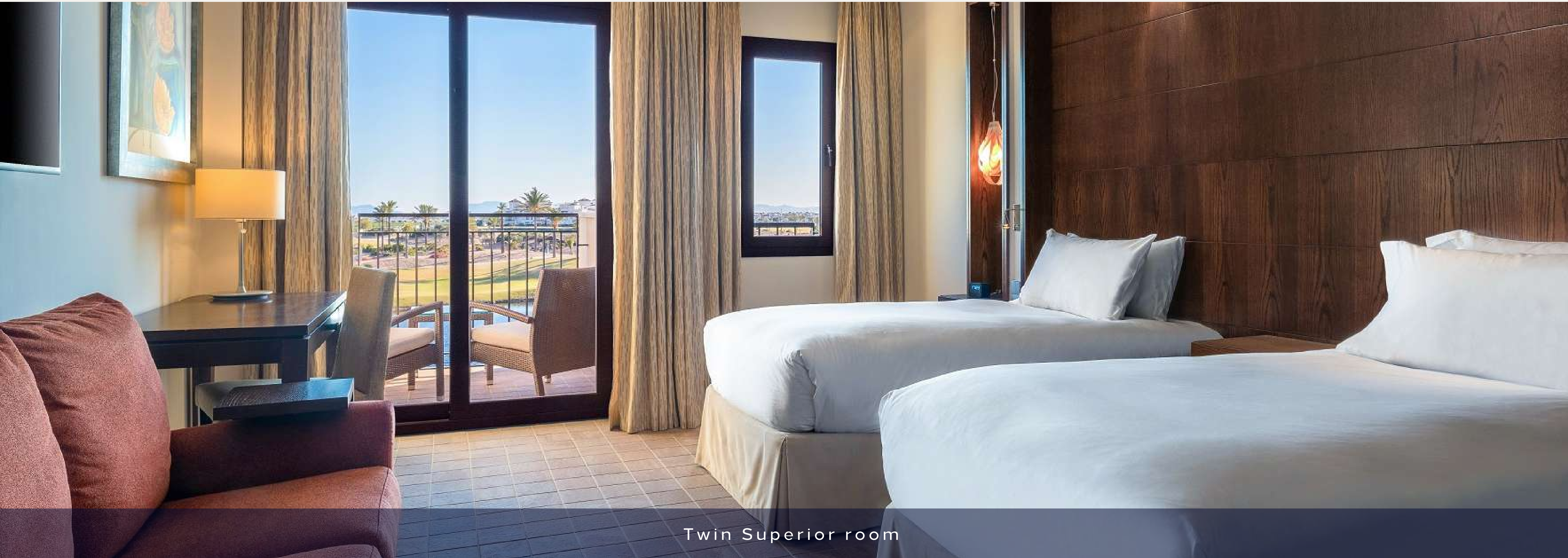
Twin Superior room