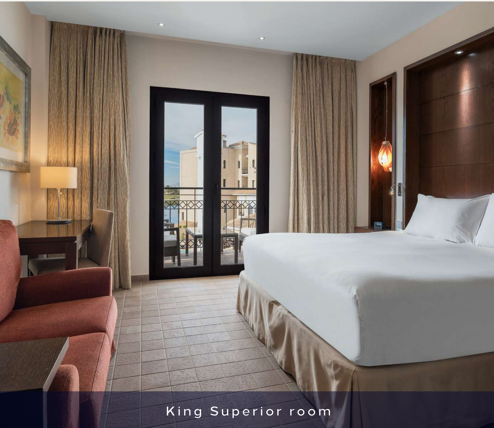
King Superior room

133 habitaciones: 46 Twin y 87 King Size bed. Categoría: Superior room.