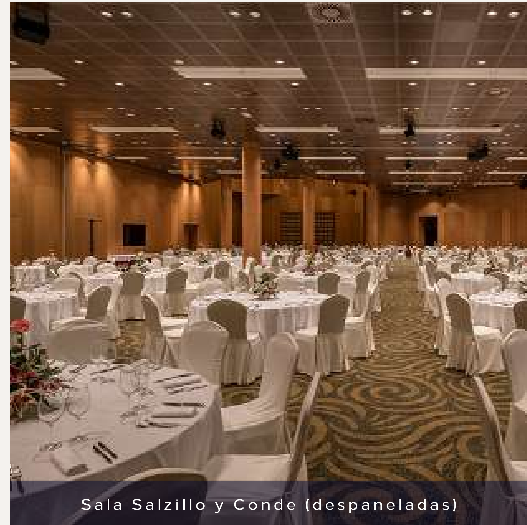
Sala Salzillo y Conde (despaneladas)