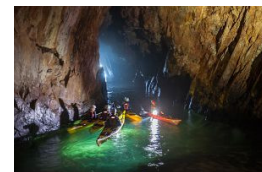
Interior de la cueva d'en Gispert en Palafrugell (Girona).

La Costa Brava es inigualable a la hora de dar paladas entre estéticos roquedos rondados por aguas profundas y pinos elevándose a menudo en lugares inverosímiles Kayaking Costa Brava organiza varios recorridos, pero la excursión a la cueva d'en Gispert (Begur) es la más común y demandada, al ser apta para novatos -mayores de 14 años- y salpicada con numerosos puntos de interés en los 2,7 kilómetros de ruta (ida).