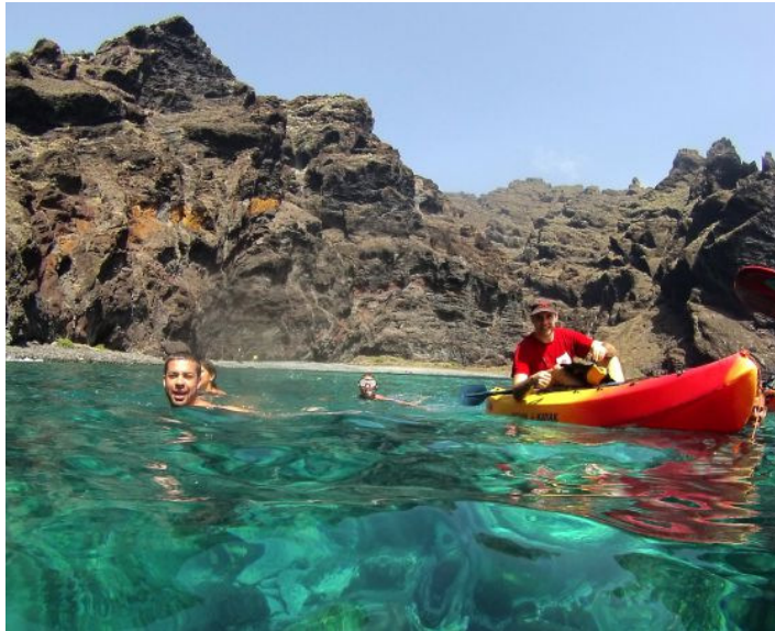
Grupo de piragüistas en el acantilado de Los Gigantes, en Tenerife. / PATEA TUS MONTES

Archivado en: Piragüismo Deportes acuáticos Deportes