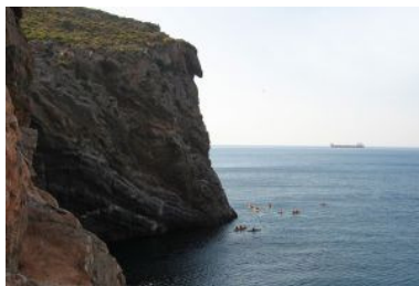
Ruta por la punta del Moco, en Cartagena (Murcia).

Para los que estén más en forma, existe la posibilidad de bajar a pie el barranco de Masca (tres horas) y continuar después en kayak hasta el puerto de los Gigantes. Por efecto de la casualidad, alguno verá cómo los delfines pasan por debajo de su quilla. Las embarcaciones son dobles, de manera que si alguien se lesionara, el monitor se convierte en eventual acompañante.