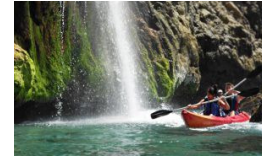
Cascada de Maro en Málaga.

programe organice tres salidas guiadas al día (a las 10.00, 13.00, y 16.00. Hasta el 31 de octubre). Tomando como punto de partida la playa de Burriana, en Nerja, ofrecen tres horas de recorrido por el paraje natural Acantilados de Maro-Cerro Gordo en kayaks recreativos individuales y dobles autovaciables (cursillo incluido. Edad mínima, 6 años).