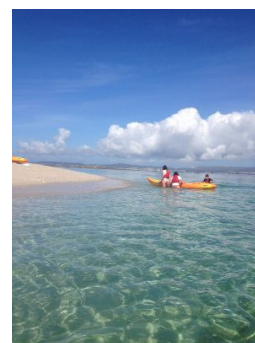
Islote de Areoso en la ría de Arousa. / PIRAGÜILLA

Nadie debería perderse A Illa de Arousa, que, pese a su puente, traslada el característico relajamiento que toda isla depara. La ría arosana pone una nota de tranquilidad al oleaje muy de agradecer. Lo mejor es diseñar una ruta a la carta, para media jornada o día completo, con la empresa Piragüilla , pudiendo ser recogido con solo avisar por teléfono. Se entrega un bidón estanco para la bebida, la cámara fotográfica y demás enseres personales. Cabe la posibilidad de ir con monitor.