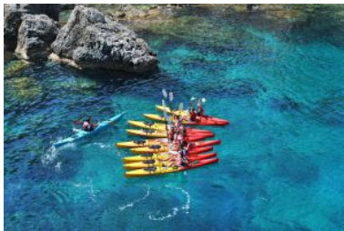
Costeando el cabo Formentor en Pollença (Mallorca).

La salida desde La Fabriquilla -6 kilómetros en total- promete fotografías inolvidables puesto que se dobla el cabo de Gata, epicentro y símbolo del parque natural, con su faro; y se atraviesan los pasillos que se forman en el arrecife volcánico de las Sirenas, entre aguas turquesas y a la vista del cerro de la Vela Blanca, más bello incluso que el propio cabo de Gata. La elección de la ruta depende de las condiciones de la ola y el viento.