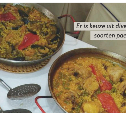
Er is keuze uit diverse soorten paella.