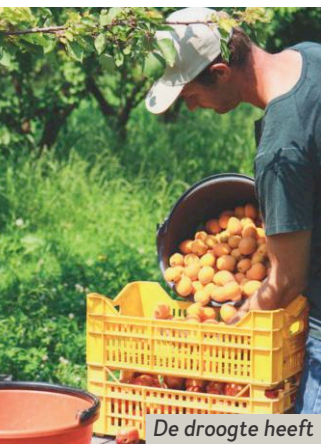
De droogte heeft invloed op de perzikoogst.