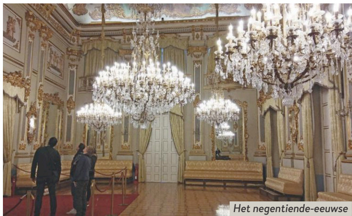
Het negentiende-eeuwse Casino in de stad Murcia.