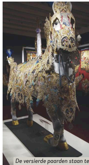
De versierde paarden staan te pronken in Caravaca.

zelfs tot heilige stad verklaard, net als onder andere Santiago de Compostela en Rome. Dit jaar is er in de stad weer een zogenoemd jubeljaar, in de katholieke kerk een heilig jaar met speciale, kerkelijke rituelen. Volgens een legende bekeerde de Moorse koning Abu Zeid zich in 1232 tot het christendom, toen hij zag hoe twee engelen een kruis brachten bij een gevangen genomen priester, zodat die een mis kon opdragen.