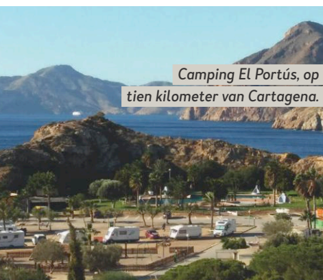
Camping El Portús, op tien kilometer van Cartagena.

Een stevige wandeling leidt ons naar sneeuw hutten met een gat in het dak