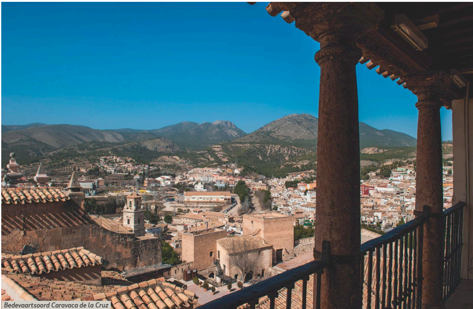
Bedevaartsoord Caravaca de la Cruz is heilig verklaard door de paus.

hij er kwam, was het dorp ten dode opgeschreven, vertelt hij. Nu kunnen bezoekers van de Sierra Espuña op zijn camping overnachten. Vanuit onze camper kunnen we de hoogste bergtop van 1.500 meter zien. De volgende dag wijzen duidelijke richtingborden ons via een smalle bergweg naar het bezoekerscentrum, dat de naam draagt van Ricardo Codorníu. Deze bosingenieur liet aan het eind van de negentiende eeuw de door erosie kaal geworden berghellingen herbebossen, om het water vast te houden. Het is nu een mooi natuurpark met talloze wandelpaden, waar de rivier Segura doorheen slingert.