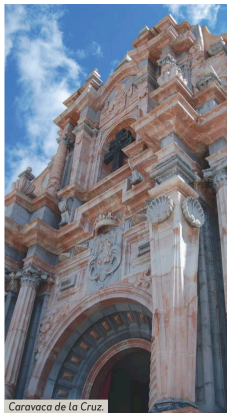
Caravaca de la Cruz.