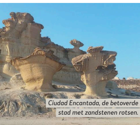
Ciudad Encantada, de betoverde stad met zandstenen rotsen.

camping El Portús op tien kilometer van Cartagena. De kleren gaan niet uit, want het wordt tegen de avond fris. Het uitzicht op de baai waaraan de camping ligt, is schitterend. We zijn niet de enige campers die hier hun domicilie hebben gekozen of sterker: het is ook voor deze camping hoogseizoen.