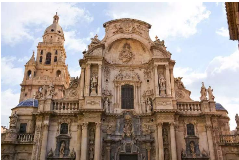
Катедралата „Св. Богородица“