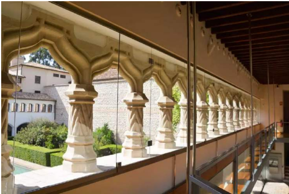
Музей към манастира „Санта Клара“

Музеят към него днес включва както действащите манастирски площи, така и архитектурни и археологически останки от старите кралски дворци на маври и испанци. В прекрасния вътрешен двор с изящни арки е съхранен един от най-старите арабски басейни в цяла Испания. На приземния етаж се намират дворцовите зали от 13 в., в които са представени експонати от историята на общност в манастира, религиозно изкуство, както и керамика и прибори от ислямска Андалусия. При разширяването на манастира през 20 в. са открити останки на още два двореца, които могат да бъдат разгледани днес. Музеят и църквата към манастира са със свободен достъп, така че не ги пропускайте.