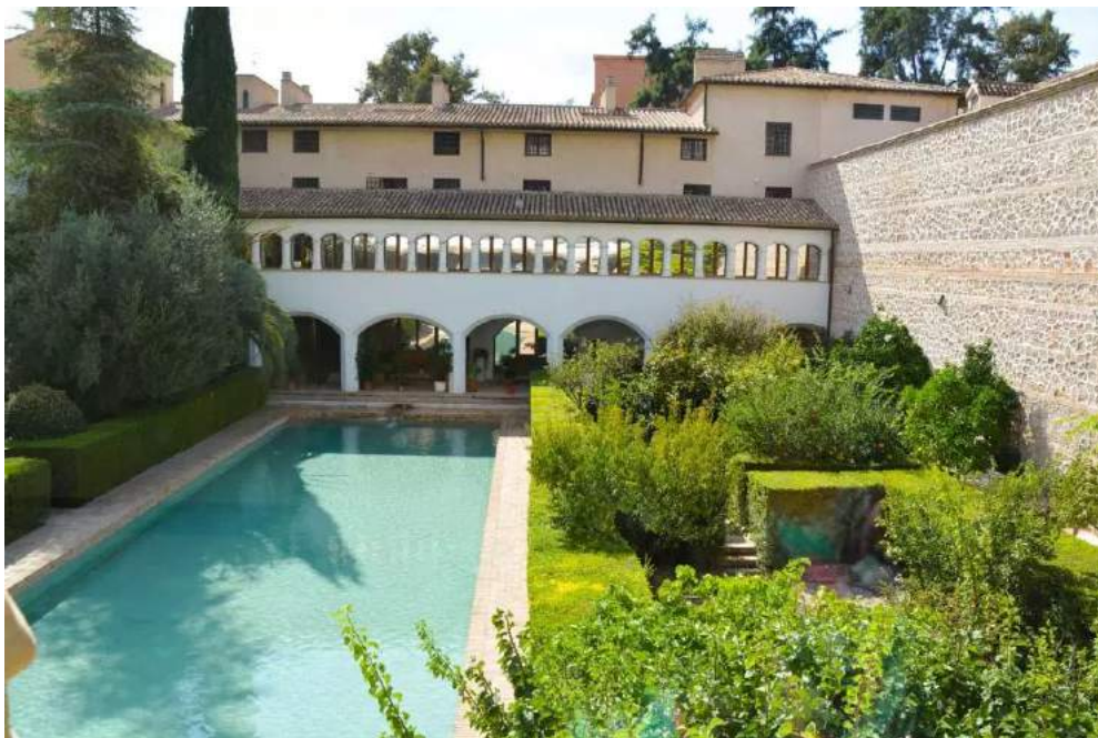
Арабски басейн в градината на манастира „Санта Клара“

Ако продължите разходката си по ул. „Траперия“ ще стигнете до площад „Санто Доминго“, наречен на едноименната църква, която се намира на него, а в близост до него в и музея „Санта Клара“. Някога дворец в стил мудехар на емира на Мурсия, Ибн Худ и ваканционно жилище на ислямската аристокрация. През 1365 г. сградата е превърната в женски манастир на ордена на св. Клара. В края на 15 в. манастирът достига невиждан до този момент разцвет, тъй като получава протекция от католическите монарси и реконструкции в готически стил. През 18 и 19 в. църквата на манастира е реновирана съответно в стил барок и стил рококо като е запазена само малка готическа част, предназначена за хора.