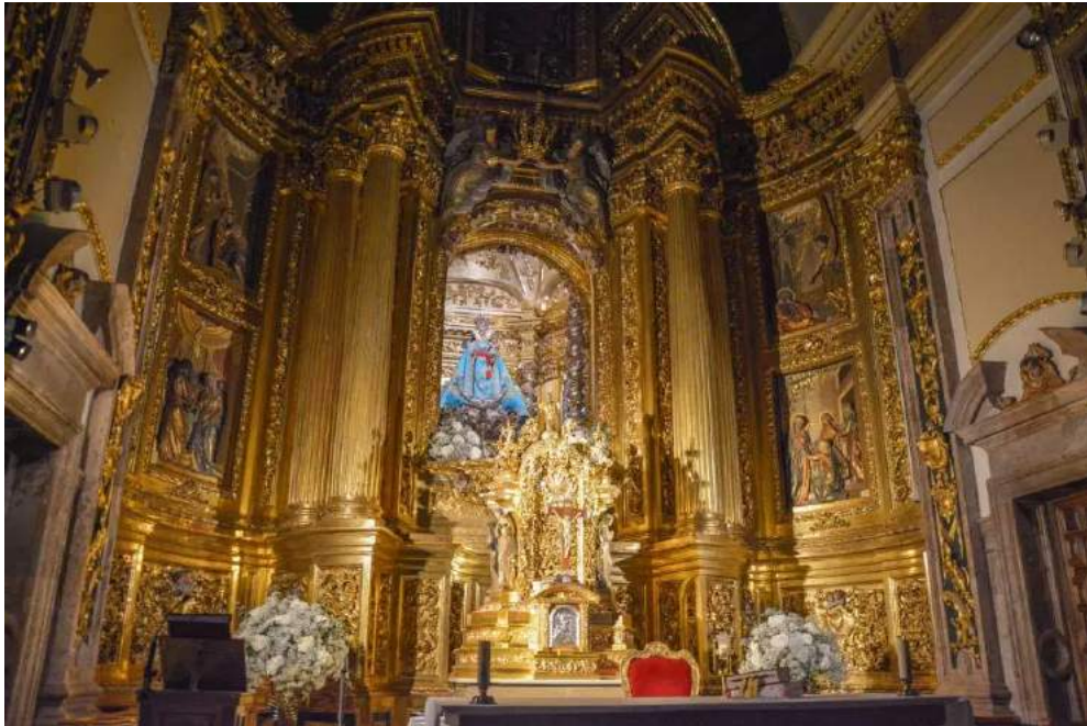
Главният олтар и скулптурата на Богородица Фуенсанта

Богородица Фуенсанта (бълг. Богородица на животворния извор) е избрана за покровителка на Мурсия, а нейният храм се намира в подножието на планинския масив Караской, на около 10 км от центъра на града. Местните жители вярват, че тя спасява многократно града от сушата през 17-ти век. Построена още тогава върху останките на стар параклис, бароковата сграда има изчистена архитектура с преобладаващ бял цвят, златисти елементи и скулптури на светци. От панорамната площадка пред нея се открива прекрасна гледка към околностите на града.